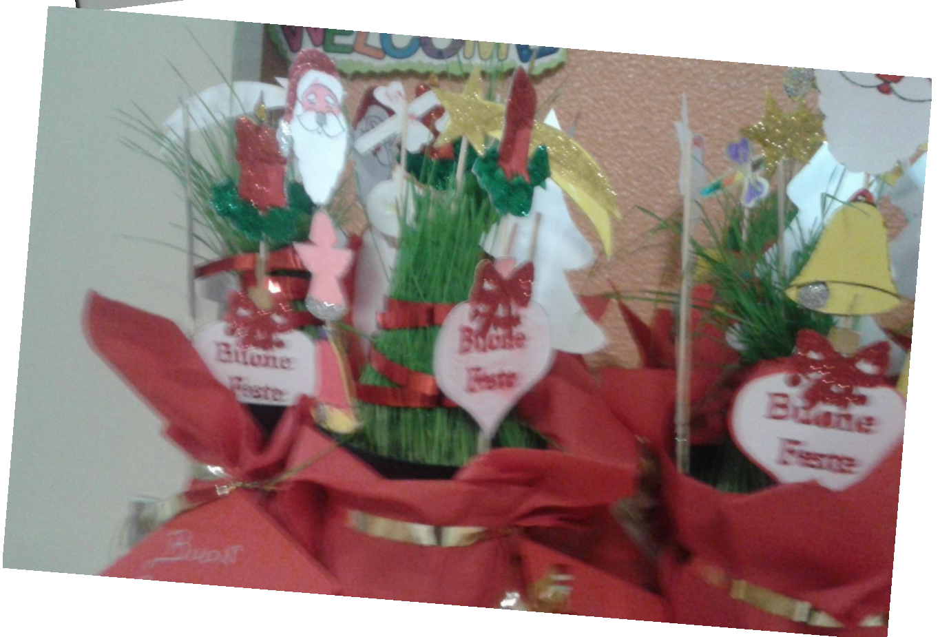
La piantina è cresciuta ed è diventata un piccolo ABETE DI NATALE